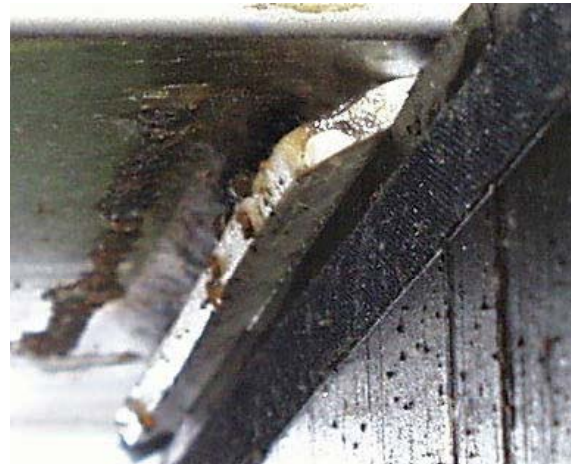
Folge klaffender Fugen ist das Austreten des PTFE

Der Gleitwiderstand führt zu einer zusätzlichen Überschreitung des Grenzwerts.