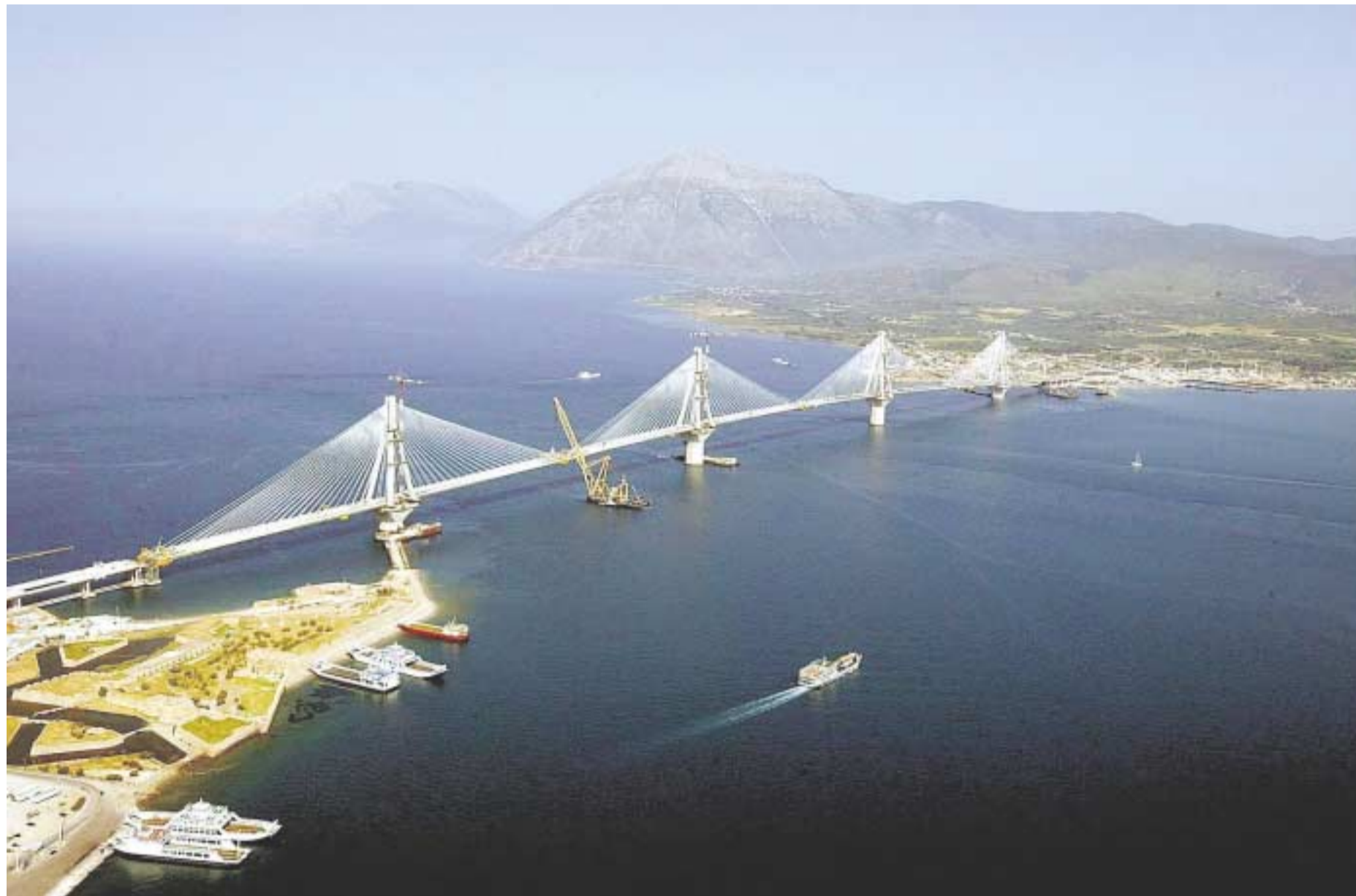
Otto Rehhagel und die griechische Fußball-Nationalmannschaft werden die Brücke einlaufen.

Ein reumütiger Bankräuber ist am Donnerstag vom Landgericht Karlsruhe zu zwei Jahren auf Bewährung verurteilt worden. Der 22 Jahre alte arbeitslose Koch hatte wegen Geldsorgen am 28. Mai eine Sparkassenfiliale in Karlsruhe überfallen und mit einer ungeladenen Schreckschußpistole rund 10 000 Euro erbeutet. Noch am selben Tag stellte er sich reuevoll der Polizei. (ddp)